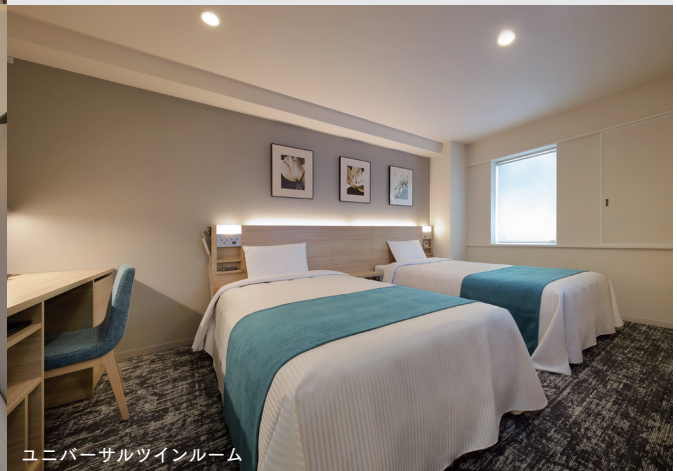
ユニバーサルツインルーム