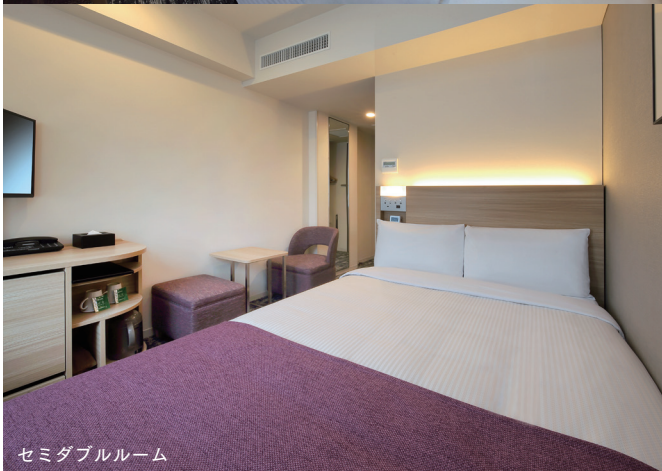
セミダブルルーム