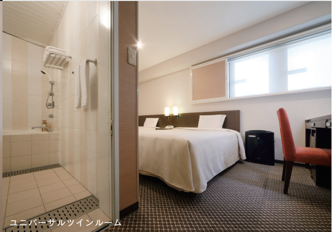
ユニバーサルツインルーム