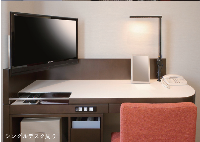
シングルデスク周り