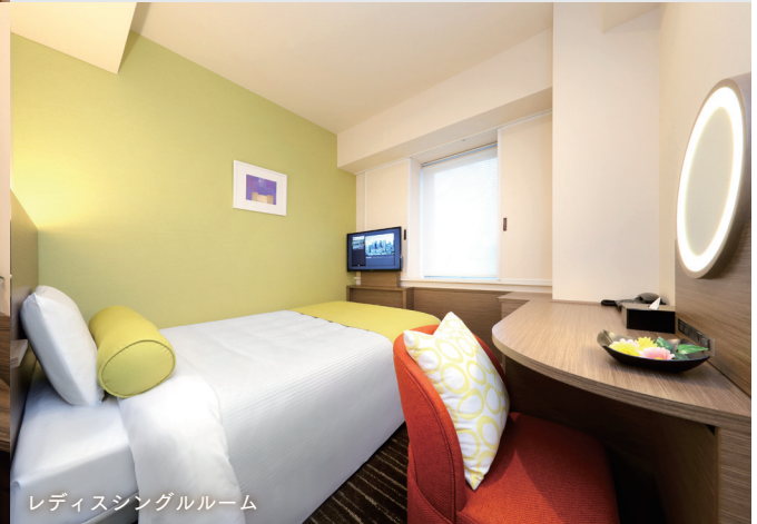
レディスシングルルーム