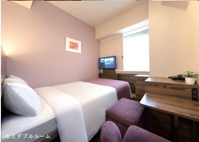
セミダブルルーム