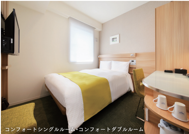
コンフォートシングルルーム・コンフォートダブルルーム