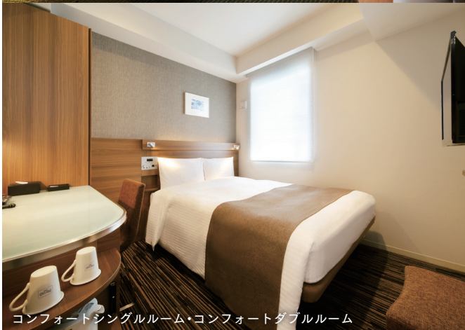
コンフォートシングルルーム・コンフォートダブルルーム