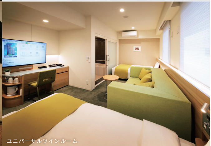
ユニバーサルツインルーム