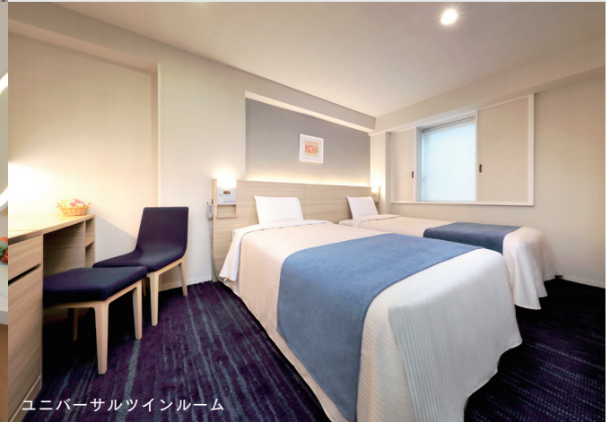
ユニバーサルツインルーム