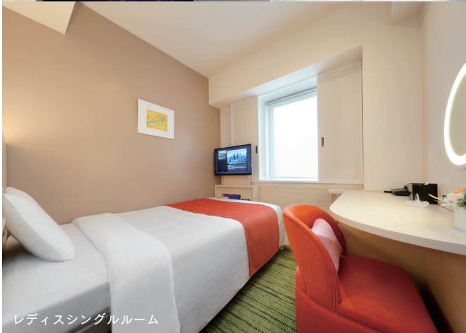
レディスシングルルーム