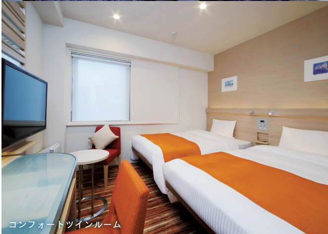
コンフォートツインルーム