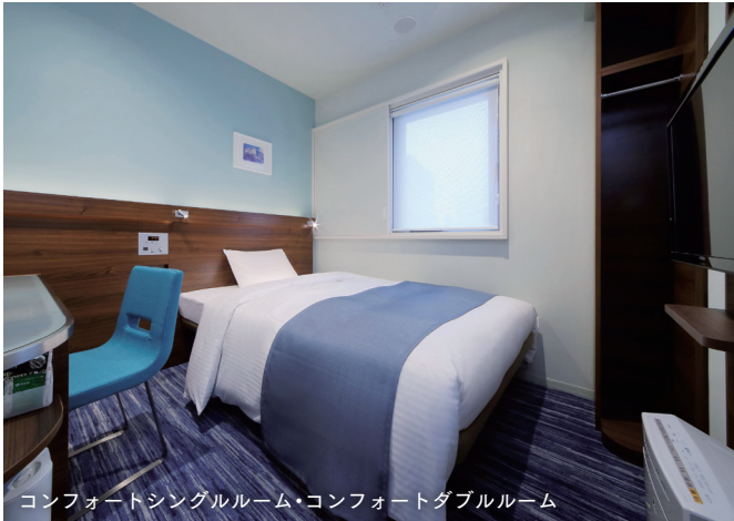
コンフォートシングルルーム・コンフォートダブルルーム