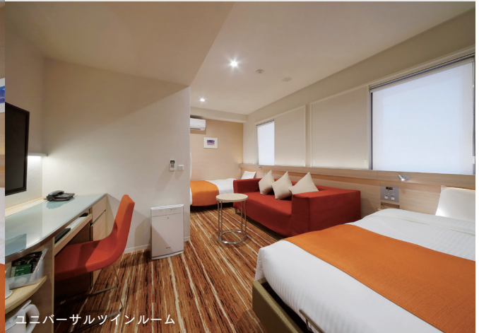
ユニバーサルツインルーム