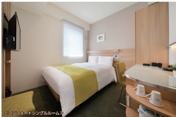
<コンフォートシングルルーム>