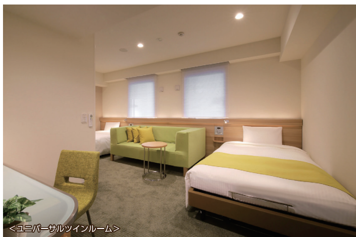
<ユニバーサルツインルーム>