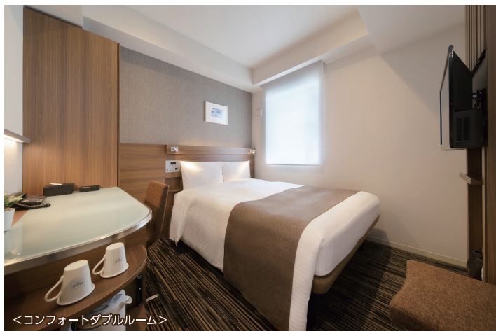
<コンフォートダブルルーム>